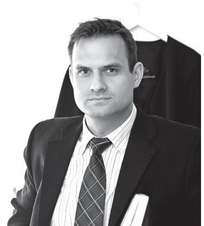
Ihr Bürgermeister Ingo Michalewski

monatlich jeden 1. Dienstag im Monat von 16:00 Uhr bis 17:00 Uhr Gemeindeverwaltung, Bergstraße 51, Niederorschel ohne Termin